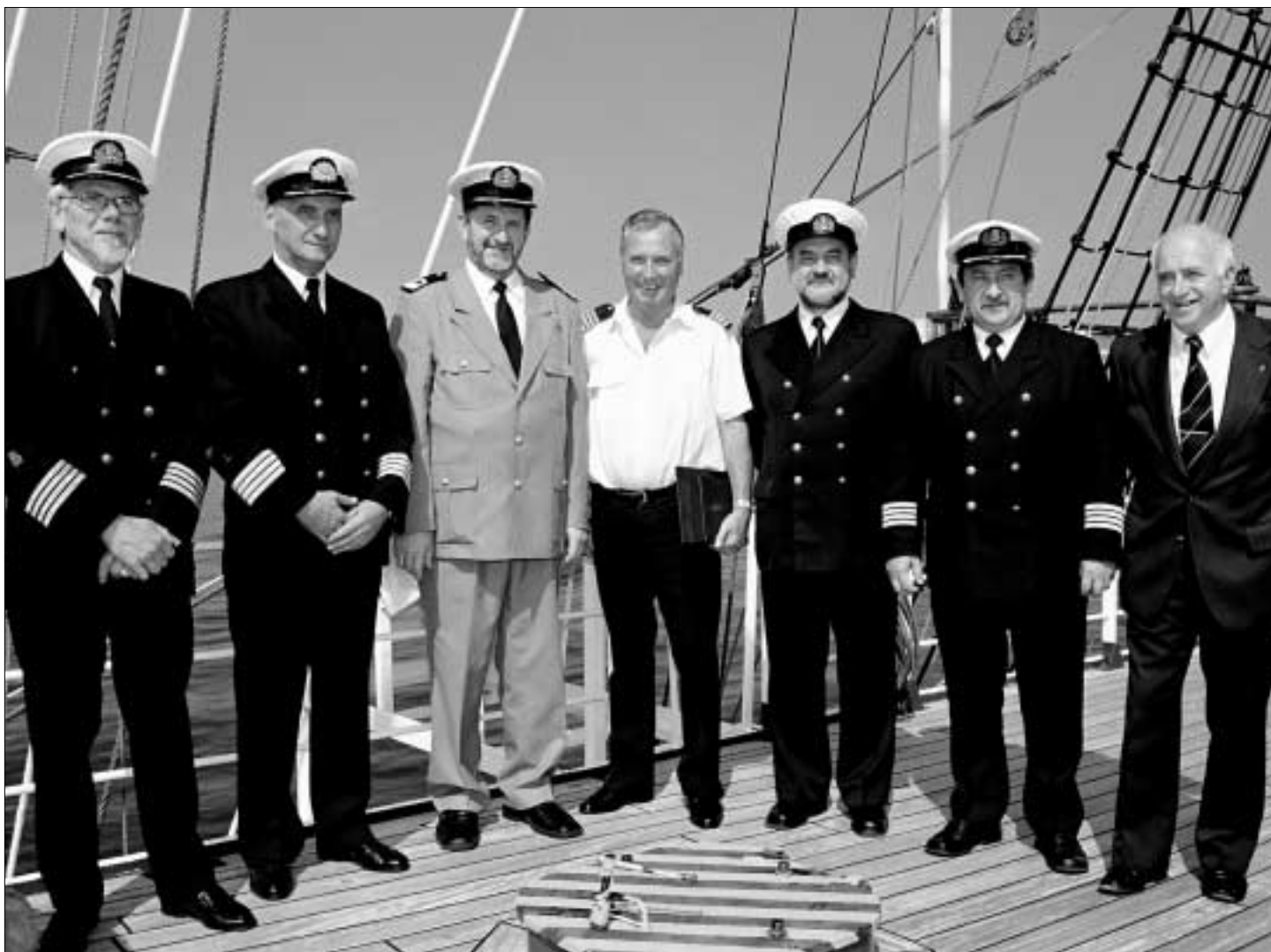
Spotkanie z okazji 20-lecia „Daru Młodzieży” – 4.07.2002r.

nistyki. Pracował w Polskich Liniach Oceanicznych w Gdyni, Polskiej Żegludze Morskiej w Szczecinie, pływał jako oficer, a następnie nawigator na wielu statkach handlowych polskiej i obcych bander, na zbiornikowcach i statkach pasażerskich. W 1984 pracował jako starszy oficer na „Darze Młodzieży” w czasie rejsu Operation Sail do Kanady. W 1985 był kapitanem w czasie budowy motorowo-żaglowego statku naukowo-badawczego „Oceania” i następnie dowodził nim przez wiele lat, przecierając szlaki dla tego typu statków na Spitzbergen. Był kapitanem największego na świecie żaglowca pasażerskiego „Royal Clipper”, dowodził też dwoma innymi żaglowcami: „Star Clipper” i „Star Flyer”. Od 2007 r. jest komendantem „Daru Młodzieży”. ■