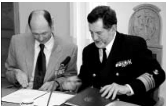
„Ceremonia podpisania porozumienia w sprawie podwójnego dyplomu na studiach II-stopnia specjalność „Przedsiębiorczość – zarządzanie zmianą” prowadzonych przez Hochschule Bremerhaven oraz Akademię Morską w Gdyni.”

Ostatnia część, od 6.05–11.05.2007, odbyła się w Gdyni, gdzie spotkali się studenci z Polski i Niemiec. W trakcie uroczystego otwarcia seminarium przez rektora Akademii Morskiej i przedstawicieli władz uczelni, zostało podpisane porozumienie w sprawie podwójnego dyplomu na studiach II stopnia specjalności: „Przedsiębiorczość – zarządzanie zmianą”, prowadzonych