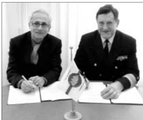
Podpisanie „Letter of Intent”

projektów rozwoju AM w Gdyni finansowanych ze środków unijnych.