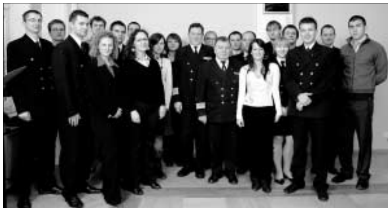
Spotkanie z Parlamentem Studentów AM