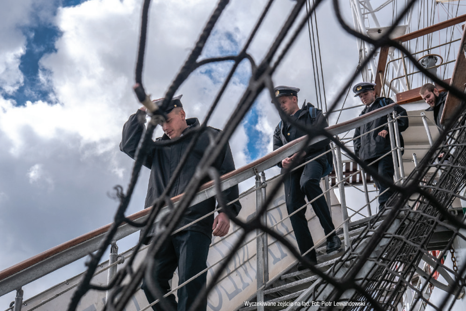
Wyczekiwane zejście na ląd.