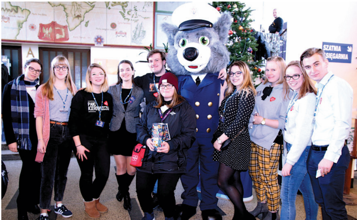
Podczas finału WOŚP nie mogło zabraknąć Wilczka Morskiego – maskotki UMG.

Jak co roku studenci i pracownicy UMG aktywnie włączyli się we wsparcie Wielkiej Orkiestry Świątecznej Pomocy. 13 stycznia 2019 r. na Wydziale Nawigacyjnym UMG odbył się Finał WOŚP z mnóstwem atrakcji dla gości. Łącznie udało nam się zebrać 9210,25 zł na ratowanie zdrowia i życia najmłodszych pacjentów. Dziękujemy wszystkim, którzy zagrali z nami dla Orkiestry – do zobaczenia za rok!