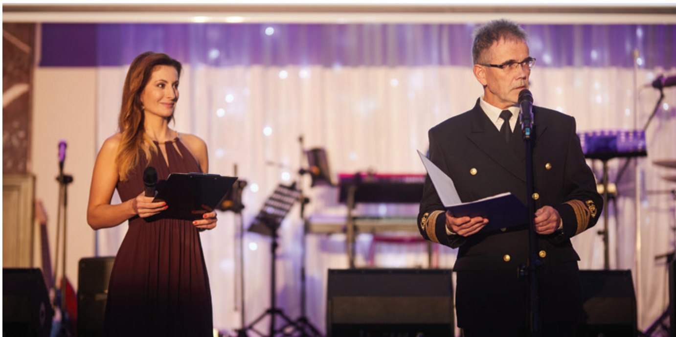
Inauguracja XXVI Balu Morskiego na UMG.