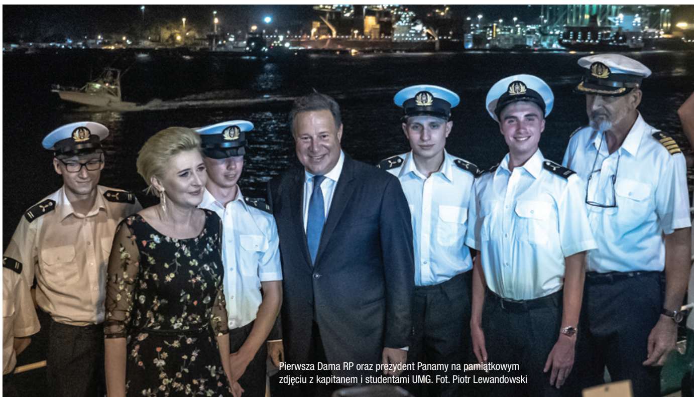
Pierwsza Dama RP oraz prezydent Panamy na pamiątkowym zdjęciu z kapitanem i studentami UMG.

Z kolei prezydent Panamy Juan Carlos Varela nawiązał do swojej wizyty w Krakowie – miasta, które było gospodarzem Światowych Dni Młodzieży w 2016 r. i z sukcesem zrealizowało to wydarzenie. Prezydent podziękował również naszym rodakom za zaangażowanie w realizację i powodzenie tegorocznego spotkania młodych w Panamie.