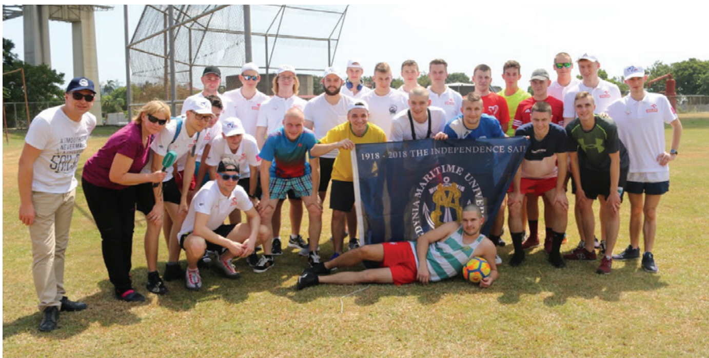
Jednym z punktów polsko-panamskiego spotkania na UMIP był mecz piłki nożnej.

Wizyta „Daru Młodzieży” w Panamie stanowiła okazję do zacieśnienia relacji z lokalną morską uczelnią – International Maritime University of Panama. Nasi reprezentanci odbyli szereg spotkań z przedstawicielami panamskiej uczelni, m.in. studenci UMIP zostali zaproszeni na pokład „Daru”, gdzie poznali specyfikę praktyk na polskim żaglowcu, z kolei reprezentanci UMG zwiedzili pracownie i laboratoria tamtejszego Uniwersytetu, w których mogli porównać technologie i urządzenia, z jakich na co dzień korzystają ich koledzy z UMIP.