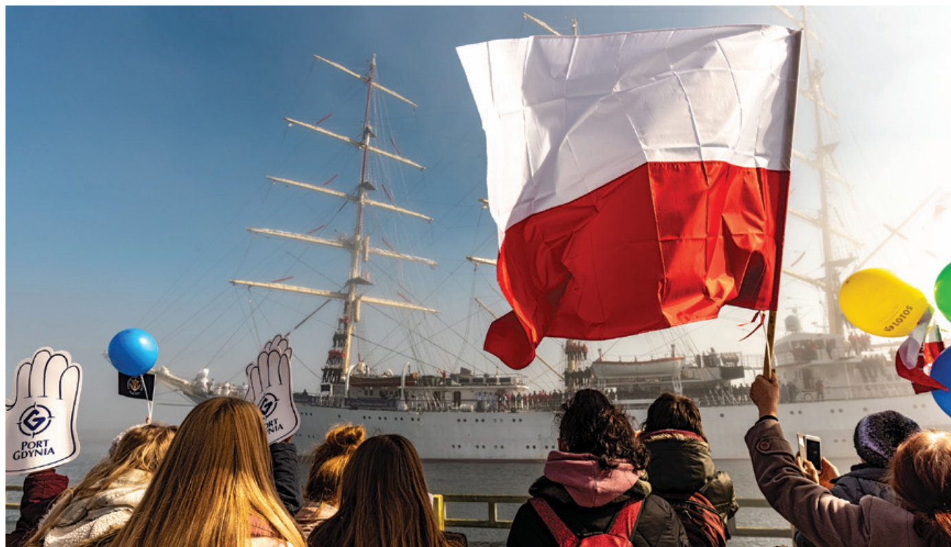
„Dar Młodzieży” wrócił do rodzinnej Gdyni po trwającym 10 miesięcy rejsie dookoła świata.

Jestem przekonany, że uczestnicy Rejsu Niepodległości doznali wielu wspaniałych przeżyć, jakie przynioszą dalekie wojaże. Kiedy wyrusza-