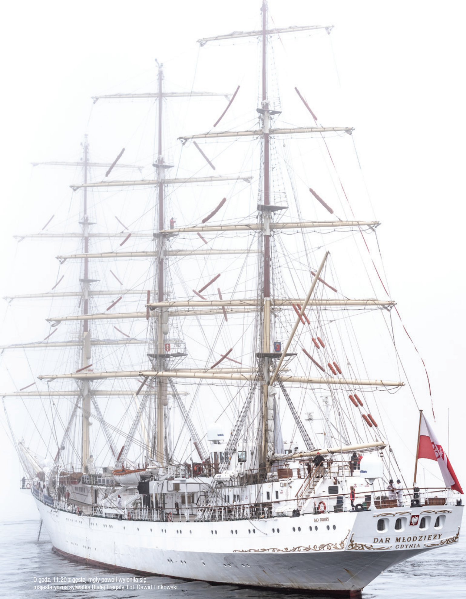
O godz. 11.20 z gęstej mgły powoli wyloniła się majestatyczna sylwetka Białej Fregaty.