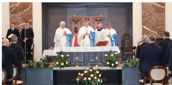
Uroczysta msza święta odprawiona w Auli im. T. Meissnera.