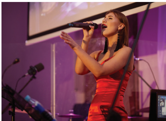
Wieczór uświetnił występ laureatki tegorocznej edycji „The Voice of University”.