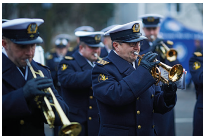
Wydarzeniu towarzyszyła oprawa muzyczna w wykonaniu Orkiestry Reprezentacyjnej Marynarki Wojennej.