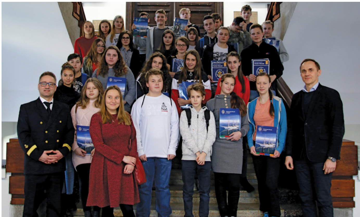
W warsztatach na terenie UMG uczestniczyło 32 uczniów klas ósmych.