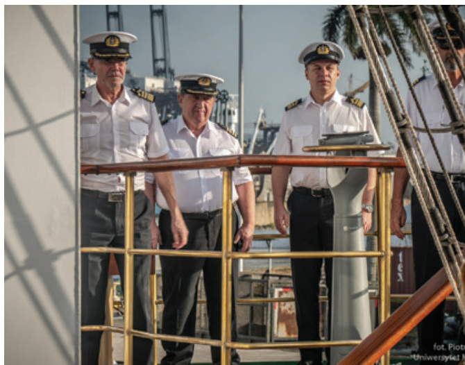
Delegacja UMG podczas wizyty w Panamie.