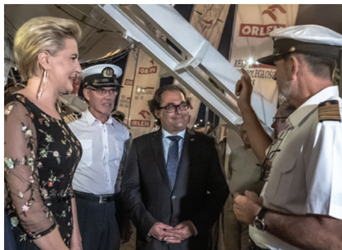
W pożegnalnym bankiecie na pokładzie „Daru” wzięła udział Pierwsza Dama RP, Agata Kornhauser-Duda.

polskiej suwerenności” (cyt. za www.prezydent.pl ) w postaci Rejsu Niepodległości. Podczas spotkania z załogą Pierwsza Dama wyraziła również przekonanie, że idea wokółziemskiego rejsu szkoleniowego z okazji 100-lecia odzyskania przez Polskę niepodległości znajdzie swoje miejsce w historii.