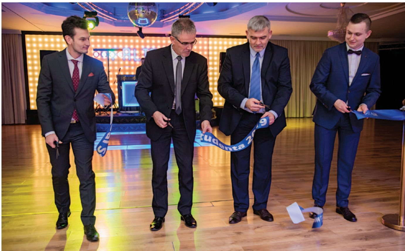
Rektorzy UMG oraz AMW podczas inauguracji Gdyńskiego Balu Studenta.

22 lutego br. w hotelu Faltom odbył się coroczny Bal Studenta, zorganizowany przez przedstawicieli Samorządu Studentów Uniwersytetu Morskiego w Gdyni oraz Akademii Marynarki Wojennej w Gdyni. Jak zwykle goście czekały atrakcje, niespodzianki, pyszne jedzenie oraz szampańska zabawa do białego rana!