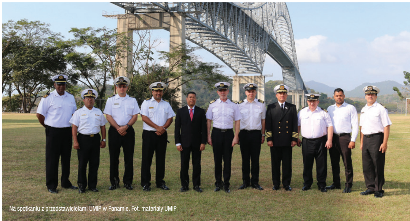
Na spotkaniu z przedstawicielami UMIP w Panamie.