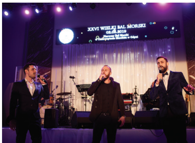
Na Balu wystąpili tenorzy z zespołu Tre Voci.