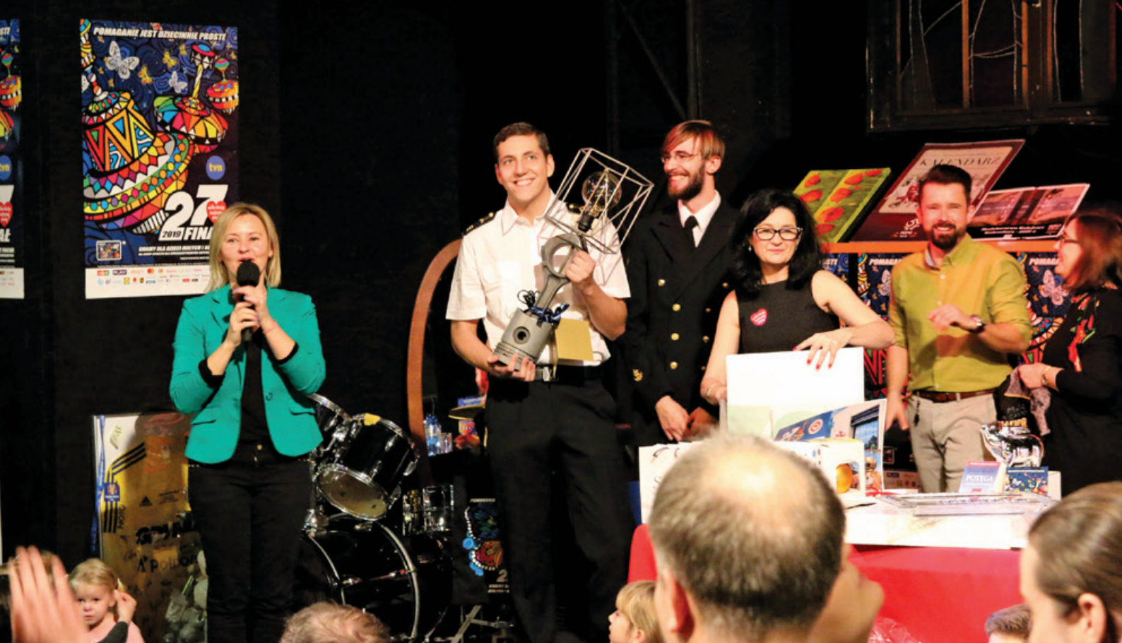
Lampa – wspólne dzieło studentów i wykładowców Wydziału Mechanicznego UMG – została wylicytowana za kwotę 2400 zł.