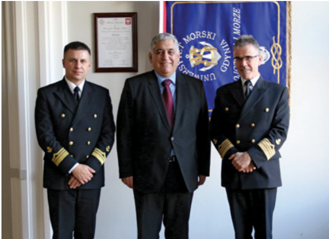
Spotkanie z rektorem bułgarskiej AMW.