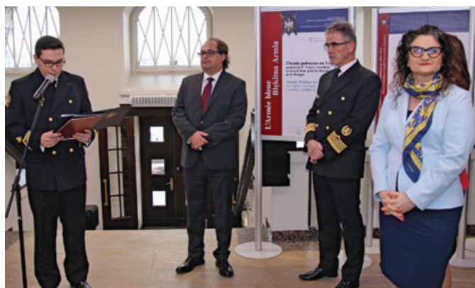
W trakcie uroczystości odbył się wernisaż wystawy poświęconej walkom o polską niepodległość.