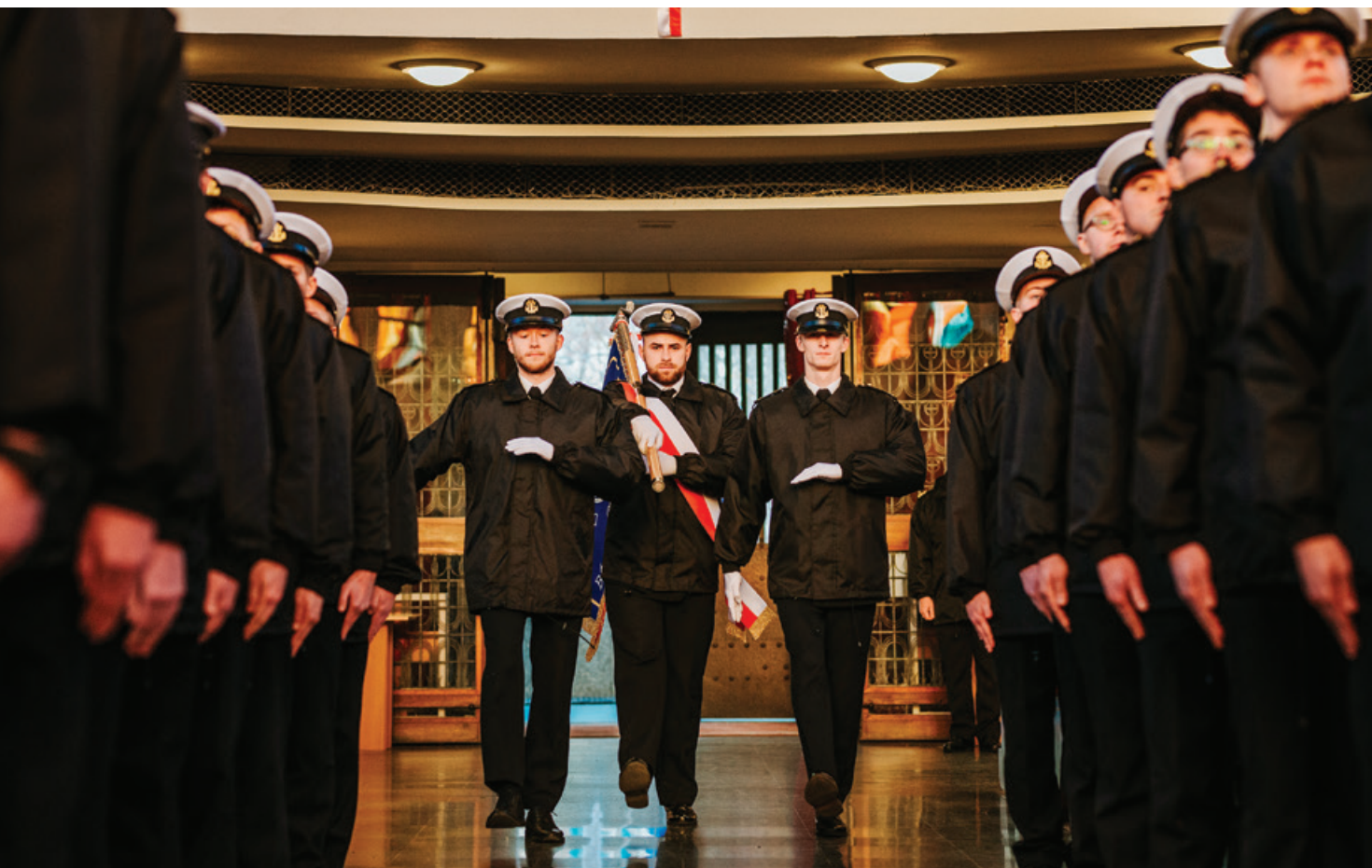
Studenci UMG podczas uroczystości kościelnych.

Tegoroczne, grudniowe święto połączyło tradycje Szkoły Morskiej w Tczewie i Uniwersytetu Morskiego w Gdyni. Idea wydarzenia pozostaje ta sama – podobnie jak 98 lat temu społeczność UMG gromadzi się, by uczcić narodziny morskiego szkolnictwa w Polsce, związane z powołaniem Szkoły Morskiej w Tczewie.