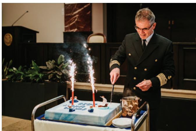
Słodki poczęstunek z okazji 98. urodzin uczelni.