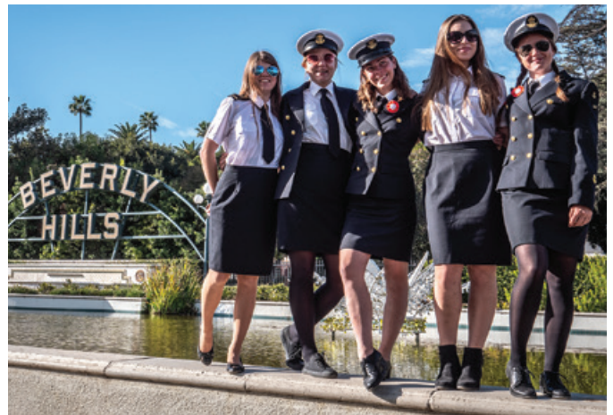
Studenci UMG odwiedzili m.in. słynne Beverly Hills.