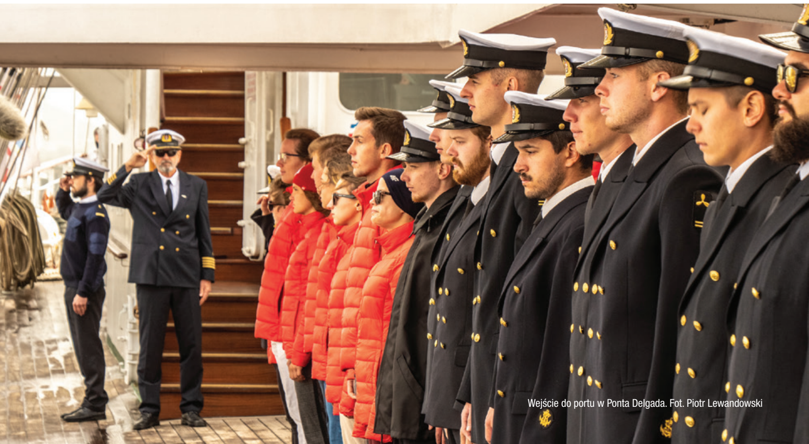
Wejście do portu w Ponta Delgada.