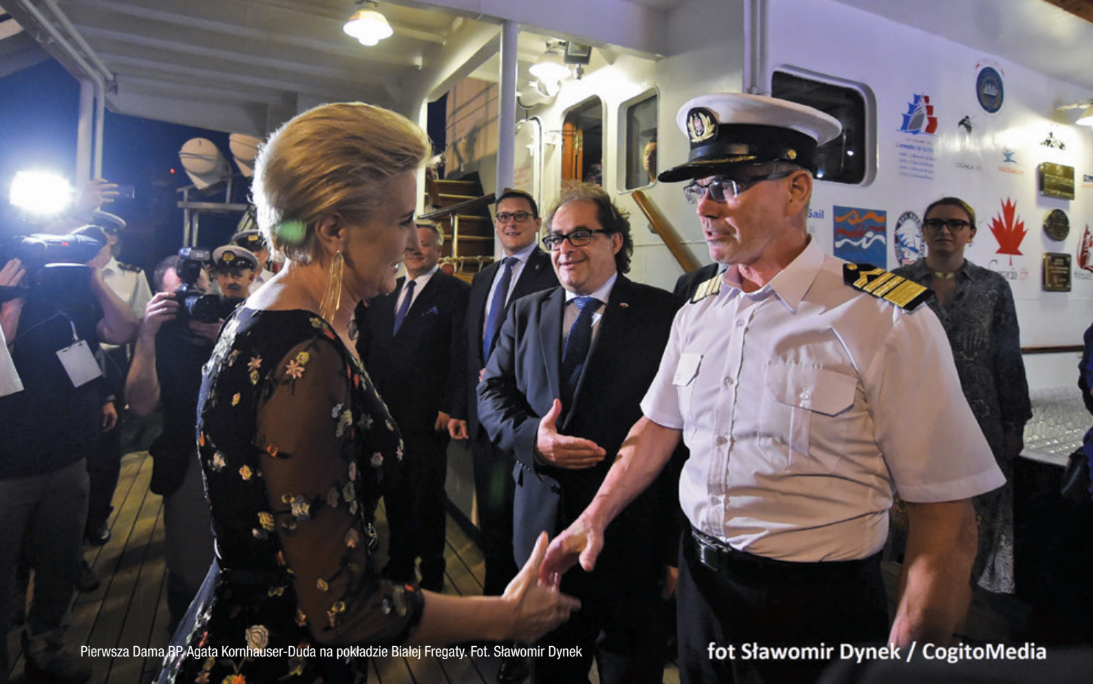
Pierwsza Dama RP Agata Kornhauser-Duda na pokładzie Białej Fregaty.