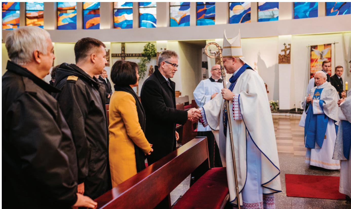
Uroczysta msza święta w kościele oo. Redemptorystów w Gdyni.