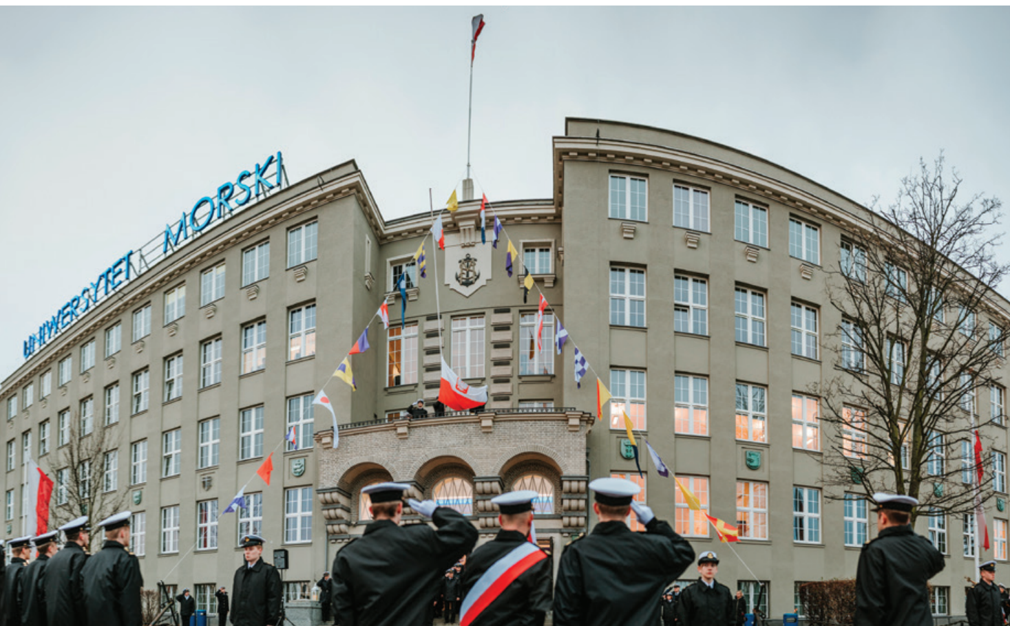
Święto Szkoły rozpoczęło tradycyjne podniesienie bandery.

Święta odbywały się nawet podczas wojny, za granicą i na statkach – życzenia z tej okazji przesyłali słuchacze z obozów jeńческих do swoich profesorów w kraju. Po wojnie, oficjalne obchody tego wydarzenia odbywały się przez ok. 2 lata, następnie nielegalnie praktykowane wśród słuchaczy. Po latach przerwy,