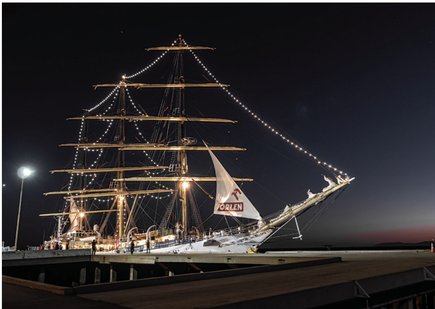
Z okazji świąt Bożego Narodzenia, „Dar Młodziży” rozbłysnął setkami światełek ułożonymi w kształt choinki.