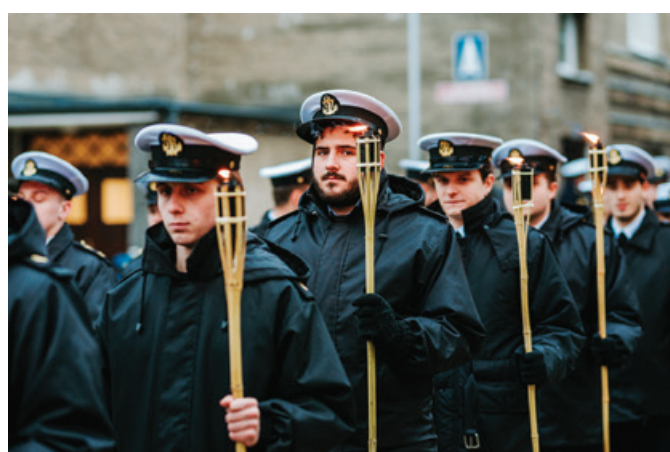
Studenci UMG podczas obchodów Święta Szkoły.