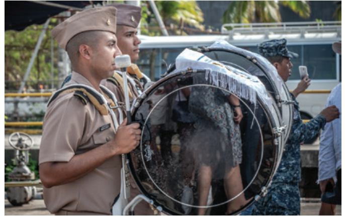
Na powitanie „Daru” rozbrzmiały hymny narodowe Polski i Panamy w wykonaniu lokalnej orkiestry.