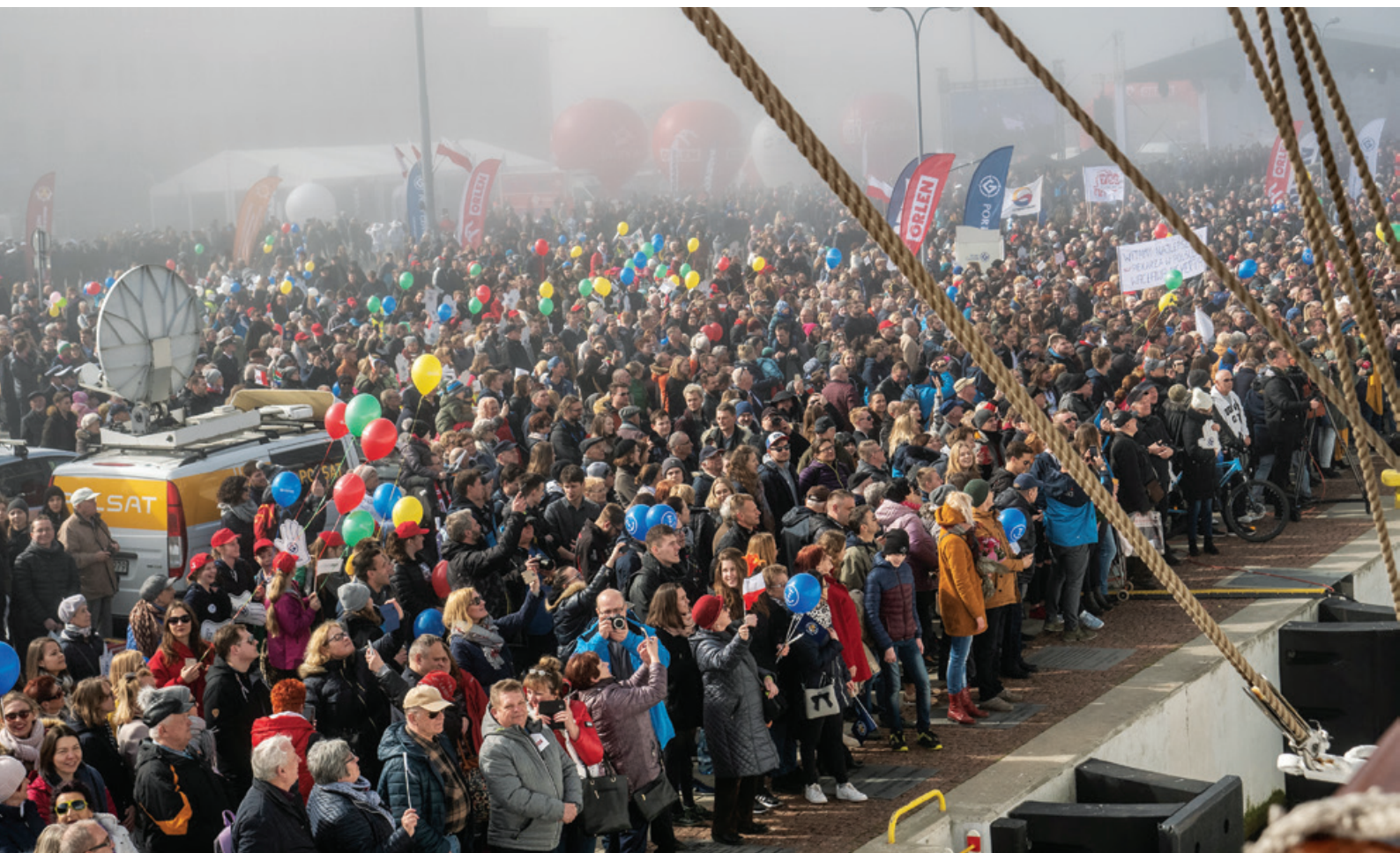
Młodych żeglarzy powitały rodziny oraz licznie zgromadzeni mieszkańcy Trójmiasta.

Tłumy zgromadzone na gdyńskim wybrzeżu oczekiwały na Białą Fregatę, kończącą wokółziemski Rejs Niepodległości. O godzinie 11.20 sylwetka „Daru Młodzieży” wyłoniła się spośród mgły – załogę witały oklaski, w niebo pofrunęły biało-czerwone balony, rozbrzmiał hymn narodowy. 28 marca 2019 r. zamknął kolejny etap historii, napisany przez 948 młodych żeglarzy, którzy przez niemal rok nieśli światu przesłanie, jaka Polska jest piękna.