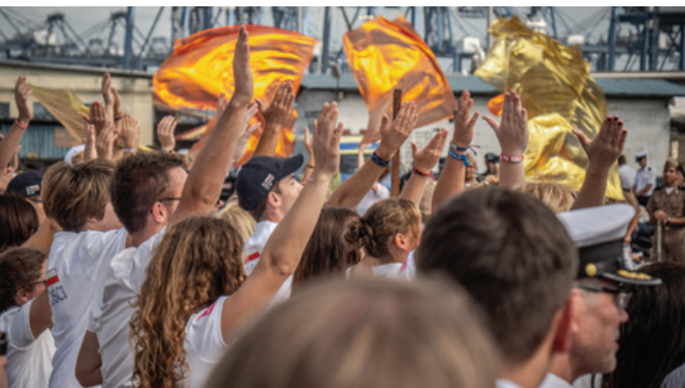
Radosna atmosfera związana z obchodami Światowych Dni Młodzieży towarzyszyła uczestnikom Rejsu do końca wizyty w Panamie.