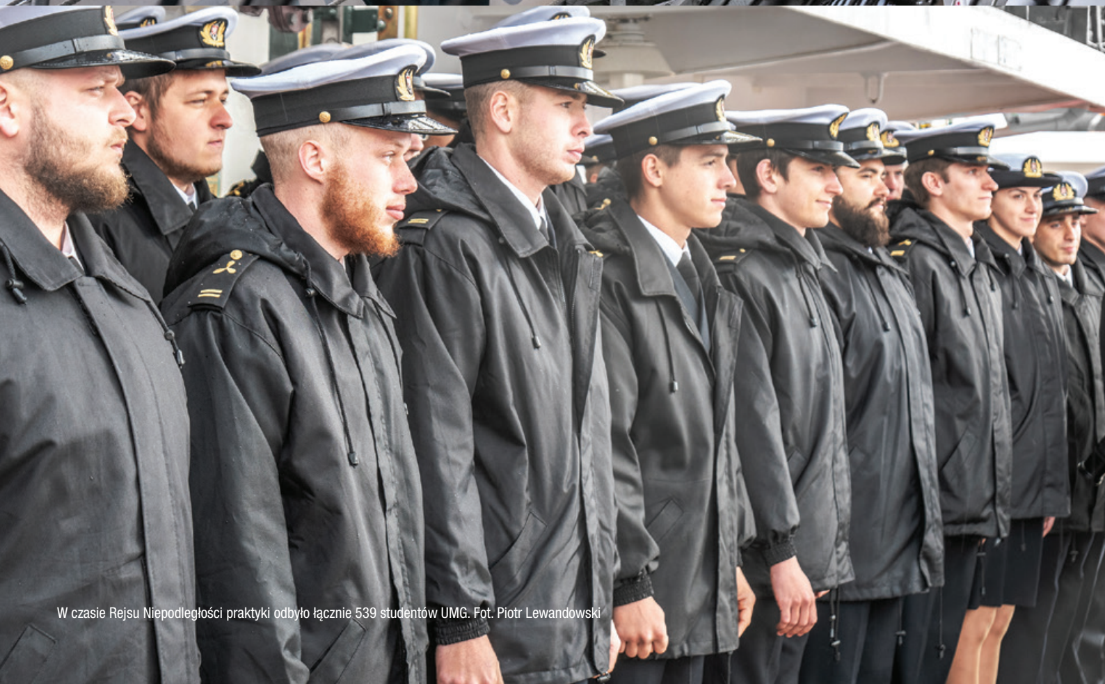
W czasie Rejsu Niepodległości praktyki odbyło łącznie 539 studentów UMG.