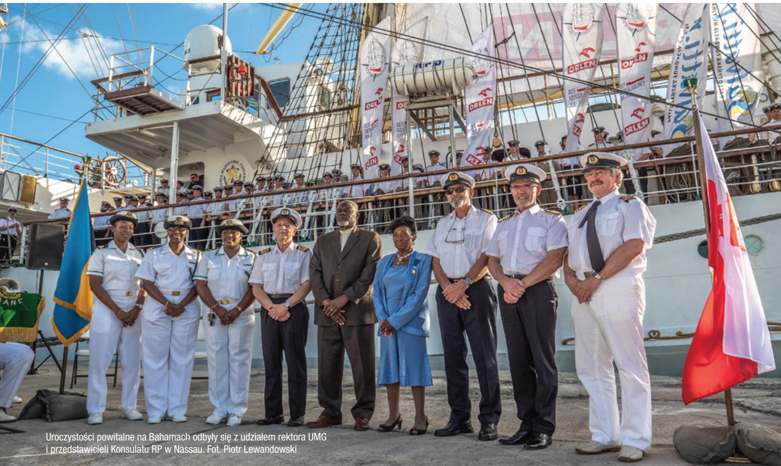
Uroczystości powitalne na Bahamach odbyły się z udziałem rektora UMG i przedstawicieli Konsulatu RP w Nassau.