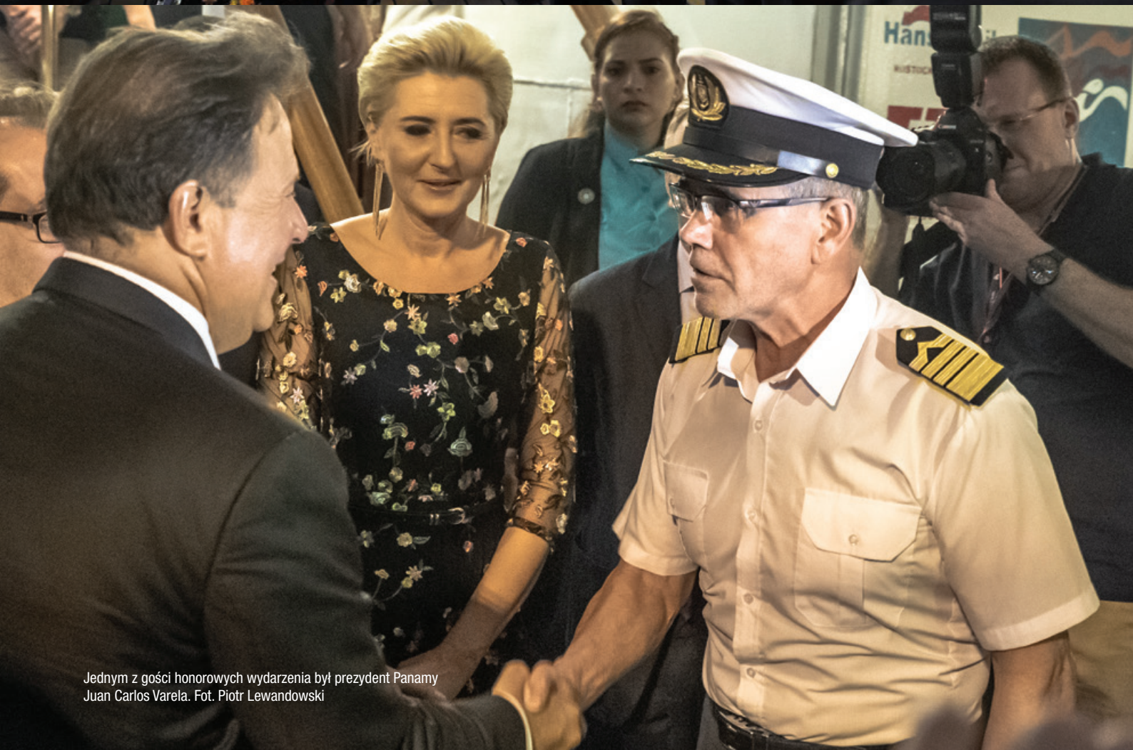
Jednym z gości honorowych wydarzenia był prezydent Panamy Juan Carlos Varela.