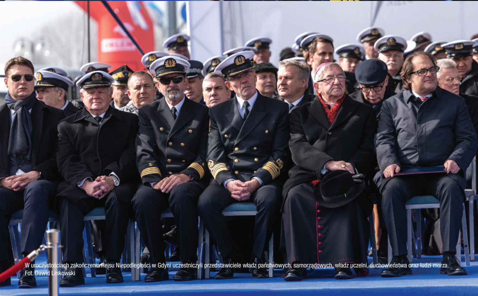
W uroczystościach zakończenia Rejsu Niepodległości w Gdyni uczestniczyli przedstawiciele władz państwowych, samorządowych, władz uczelni, duchowieństwa oraz ludzi morza.