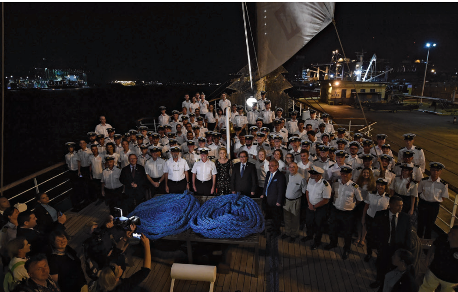
Zwierzchniem wizyty „Daru” w Panamie był uroczysty bankiet.

Historyczna wizyta „Daru Młodzieży” w Panamie miała równie wyjątkowy finał. 27 stycznia br., w ostatni wieczór pobytu w porcie Balboa, na pokładzie Białej Fregaty odbył się uroczysty bankiet, którego gośćmi honorowymi byli Pierwsza Dama RP Agata Kornhauser-Duda oraz prezydent Panamy Juan Carlos Varela.