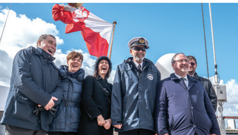
Spotkanie z przedstawicielami lokalnych władz w Londynie.