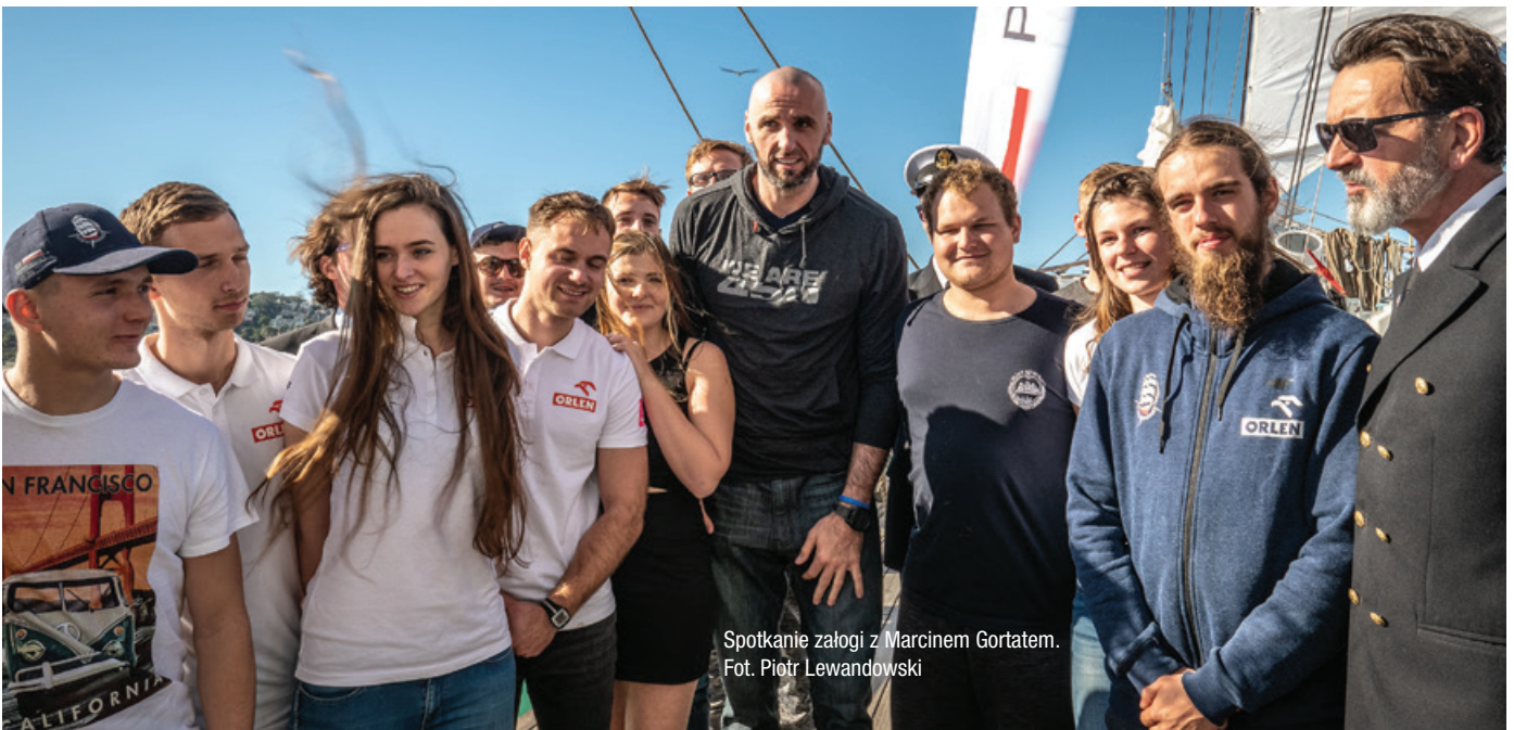
Spotkanie załogi z Marcinem Gortatem.