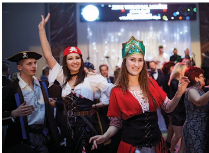
Szampańska zabawa trwała do białego rana.