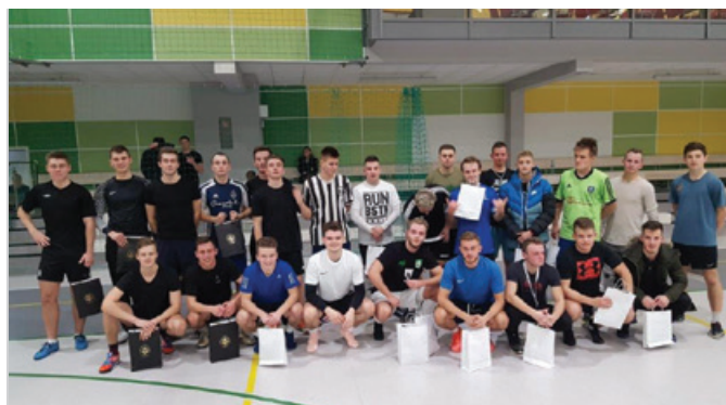
Uczestnicy turnieju sportowego, który odbył się w ramach Święta Szkoły.