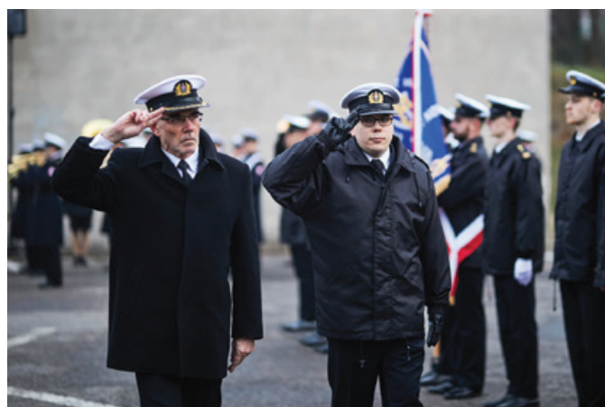
W czasie uroczystości upamiętniono założycieli naszej Alma Mater, w tym bohaterów poległych za ojczyznę.