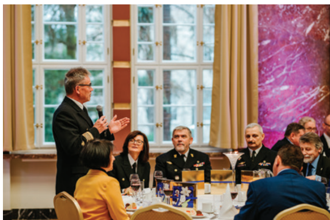
Po zakończeniu części oficjalnej goście zasiedli do uroczystego obiadu.