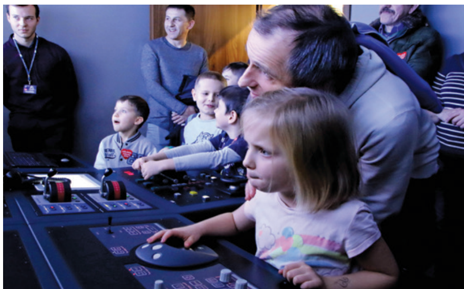
Dzięki atrakcjom na Wydziale Nawigacyjnym najmłodszy mogli poczuć się jak za sterem prawdziwego okrętu.