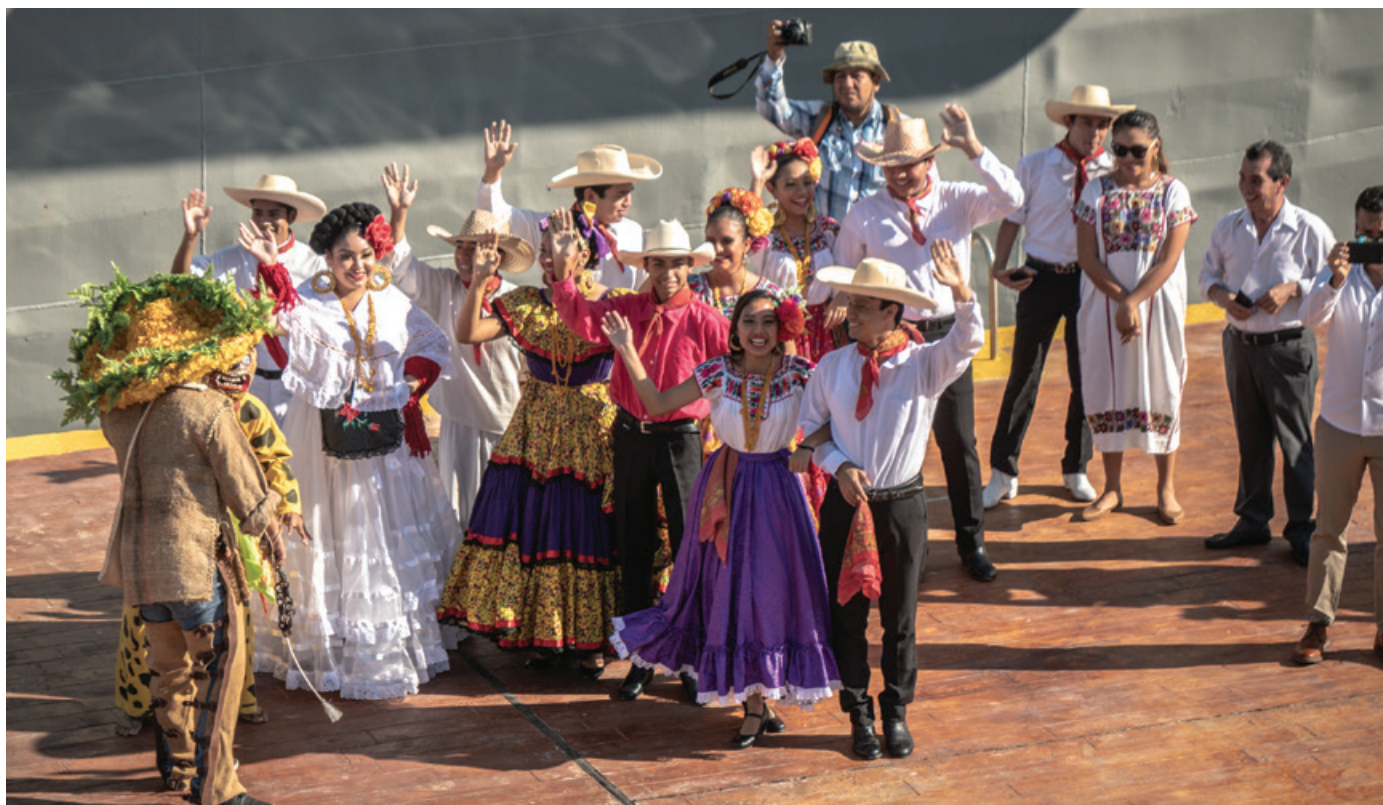
Meksyk przywitał załogę „Daru” bogactwem kolorów i radosną atmosferą.