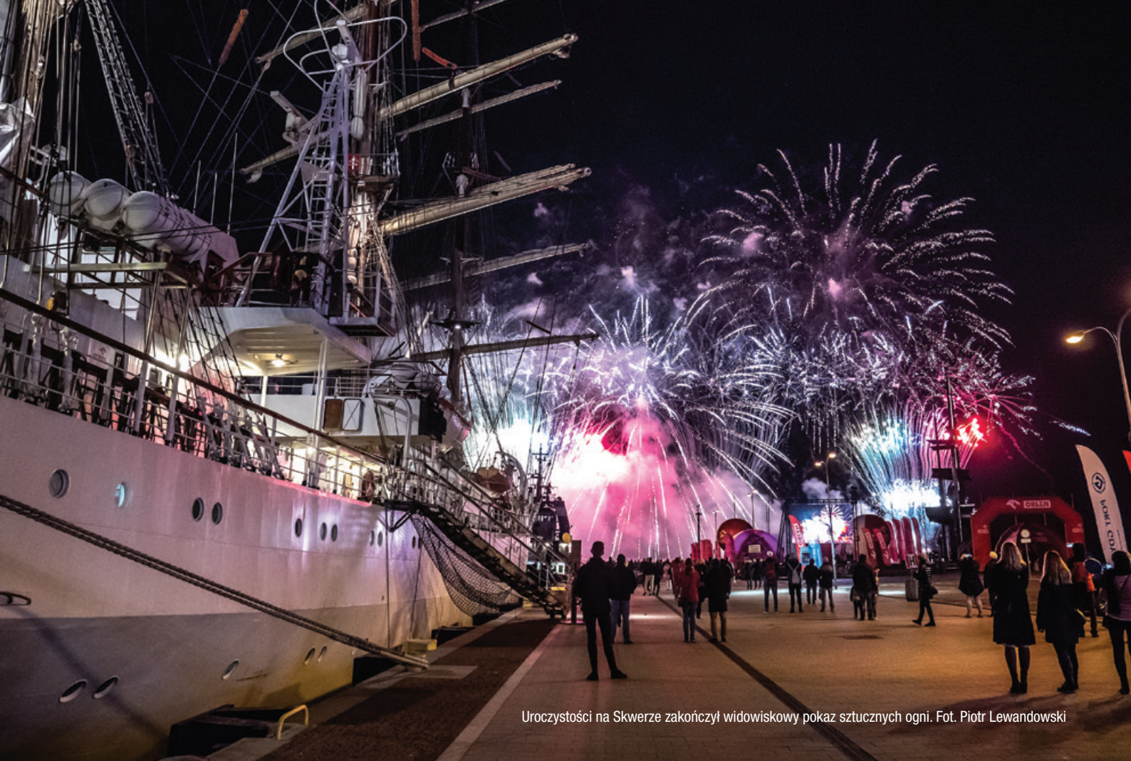
Uroczystości na Skwerze zakończył widowiskowy pokaz sztucznych ogni.