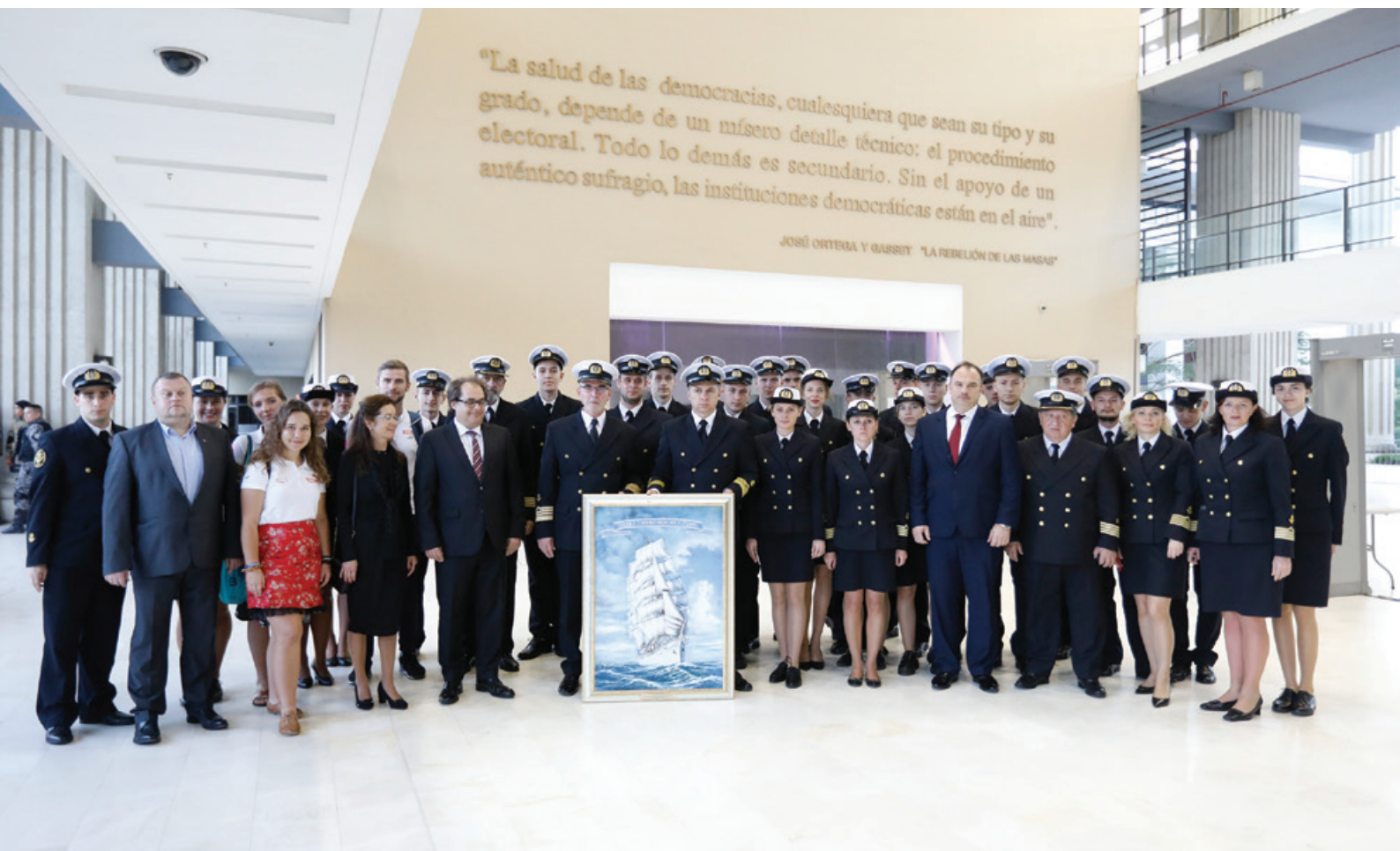
Delegacja UMG przed spotkaniem z Ojcem Świętym.

Panama, 26 stycznia 2019 r., godzina 8:15 czasu lokalnego – sobotni poranek, który na zawsze zostanie w pamięci i sercach reprezentantów UMG, uczestników historycznej audiencji u Ojca Świętego Franciszka z okazji Światowych Dni Młodzieży. Spotkanie odbyło się w serdecznej atmosferze – nie zabrakło osobistych rozmów, życzeń, a przede wszystkim wspólnej modlitwy i papieskiego błogosławieństwa, które załoga zabrała w dalszą trasę.