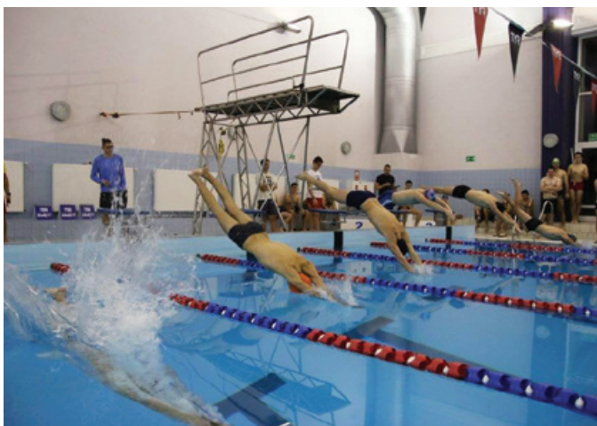
W zawodach pływackich w sztafetach zwyciężyli zawodnicy z WN UMG.