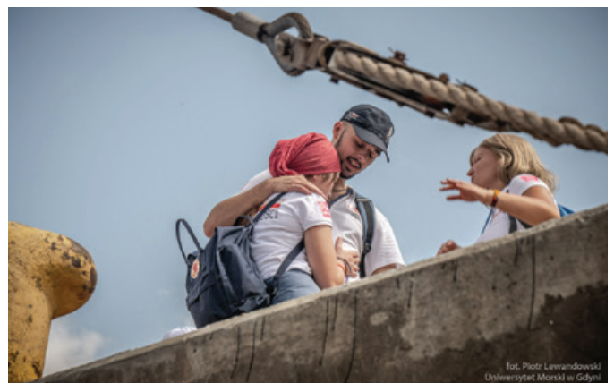
Uczestnicy Rejsu Niepodległości na panamskim nabrzeżu.