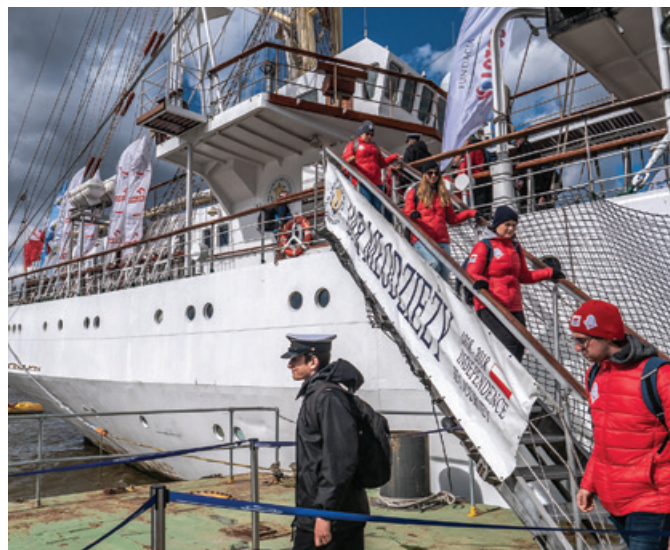
Londyn był ostatnim portem na trasie Rejsu Niepodległości przed powrotem do Gdyni.