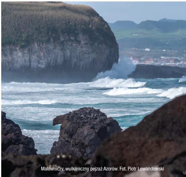
Malowniczy, wulkaniczny pejzaż Azorów.

Pozycja: 46°28'51"N, 11°37'01"W, 296. dzień podróży, przebyta trasa 33 346 Mm.