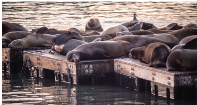
Lokalna fauna.