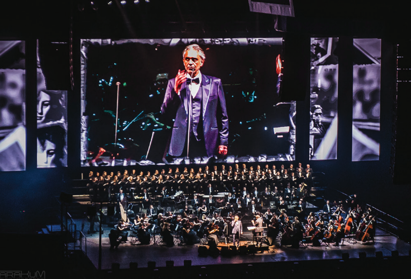
W repertuarze artysty znalazły się operowe klasyki, a także popularne utwory z musicali i filmów.

(„Cyganeria”) czy Gounouda („Romeo i Julia”), z towarzyszeniem sopranistki Marii Aleidy Soprano.