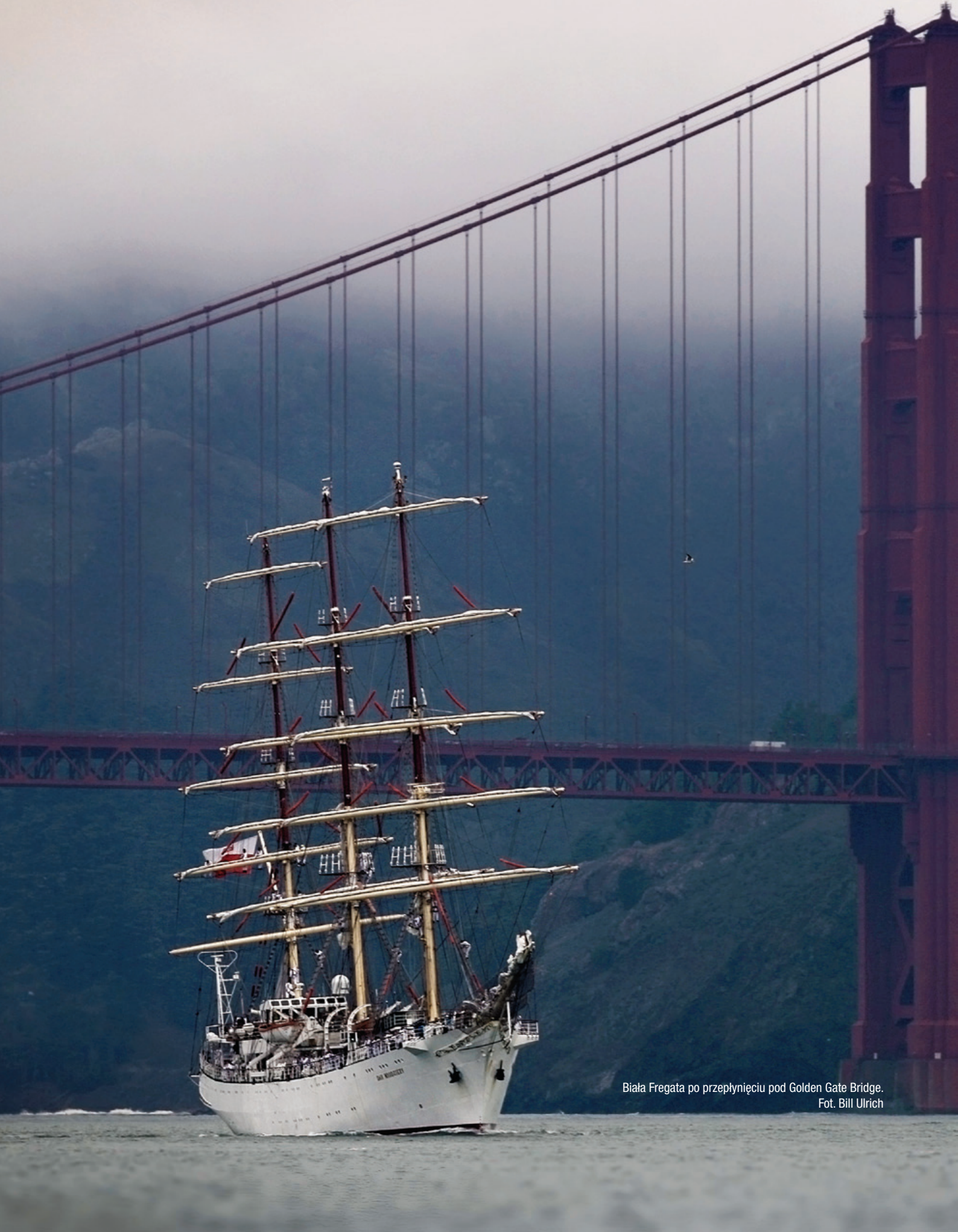
Biała Fregata po przepłynięciu pod Golden Gate Bridge.