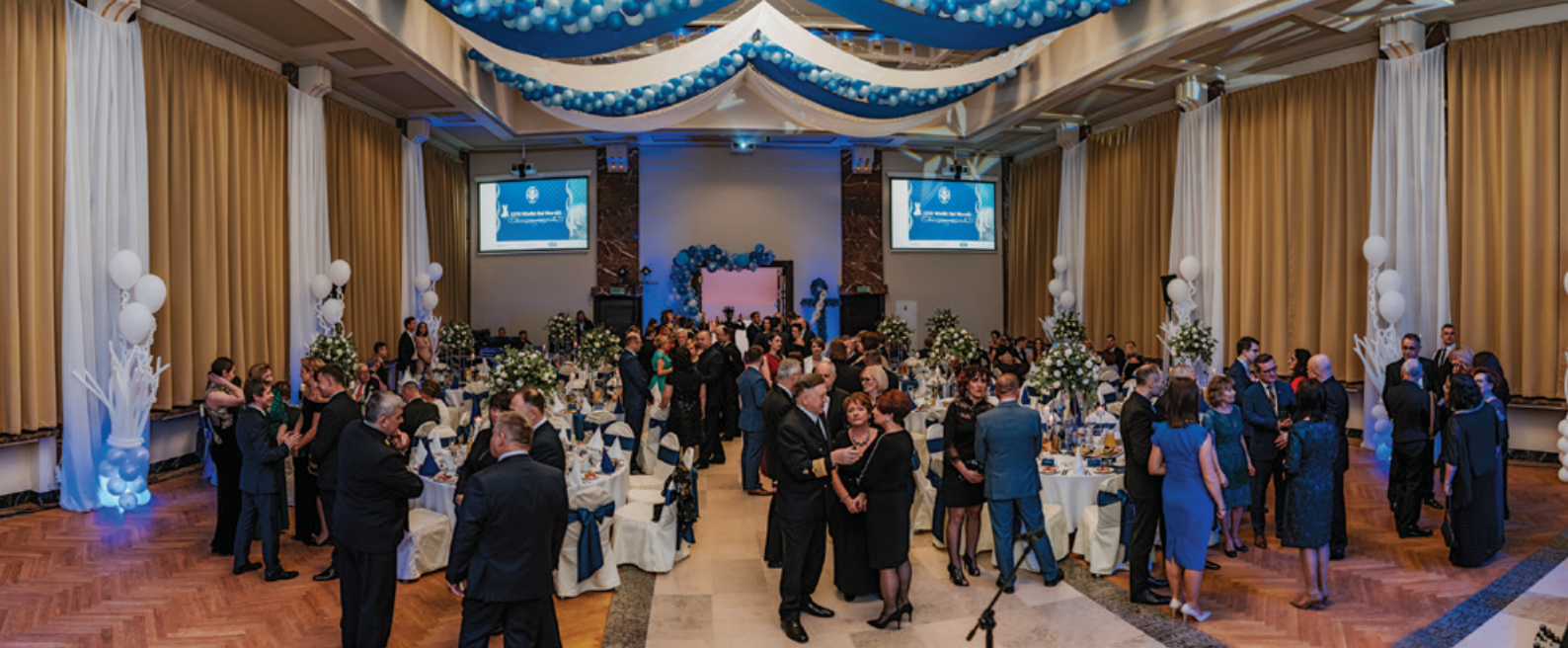
W sobotni wieczór 2 marca br. Aula im. T. Meissnera wypełniła się gośćmi.