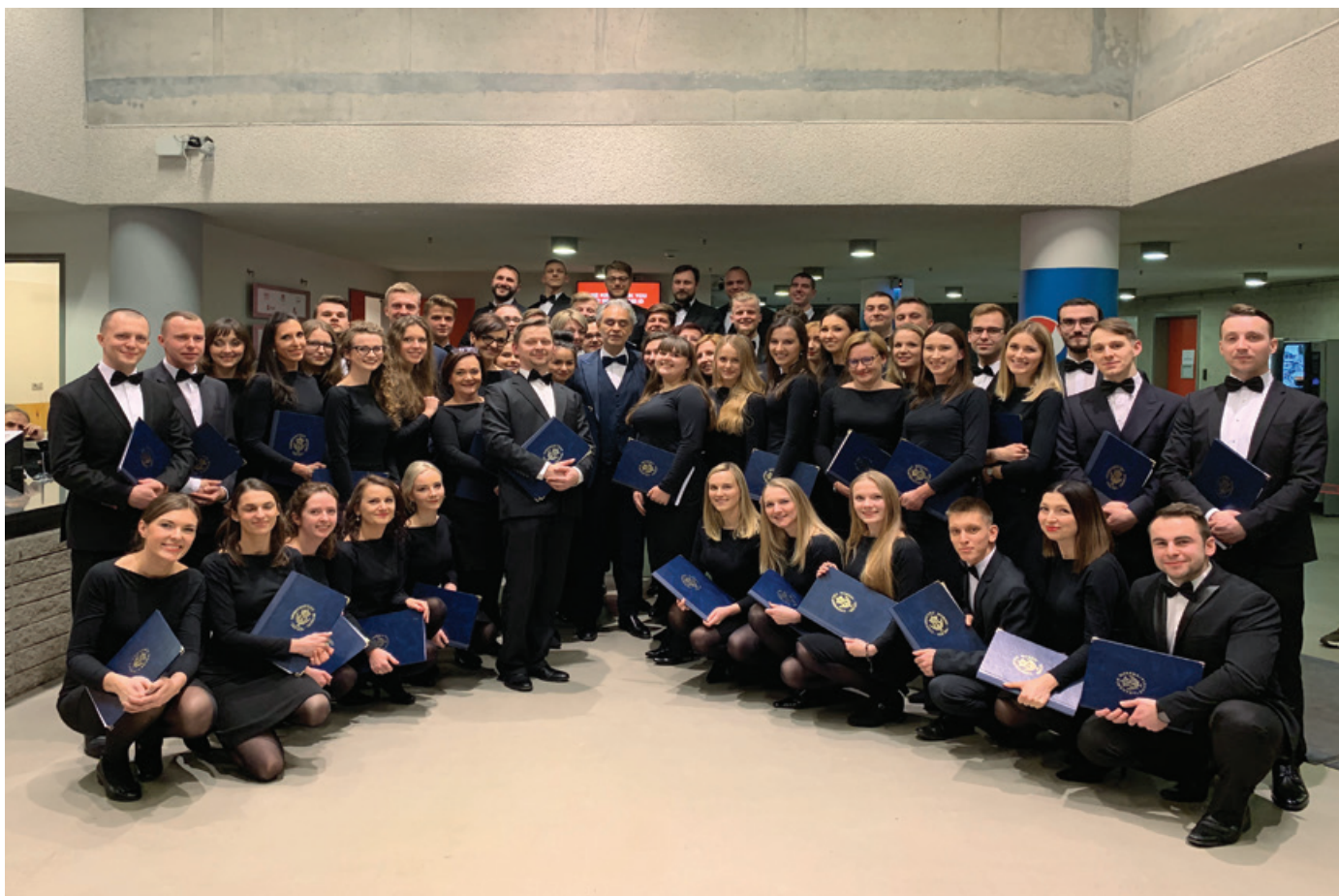
26 stycznia br. Chór UMG wystąpił ze słynnym włoskim tenorem Andrea Bocellim.

Andrea Bocelli – wybitnie utalentowany włoski tenor, znany i ceniony przez publiczność na całym świecie, wystąpił w sobotę 26 stycznia br. w trójmiejskiej Ergo Arenie. Był to niezapomniane przeżycie dla wokalistów Akademickiego Chóru Uniwersytetu Morskiego, którzy tego wieczoru zaśpiewali ze słynnym włoskim tenorem przed 9-tysięczną publicznością.