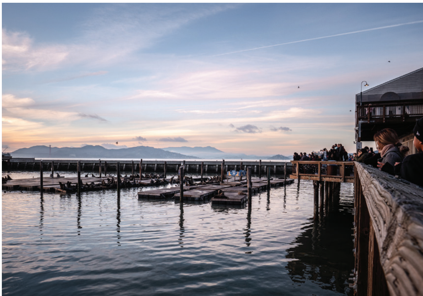
Widok na Zatokę San Francisco.