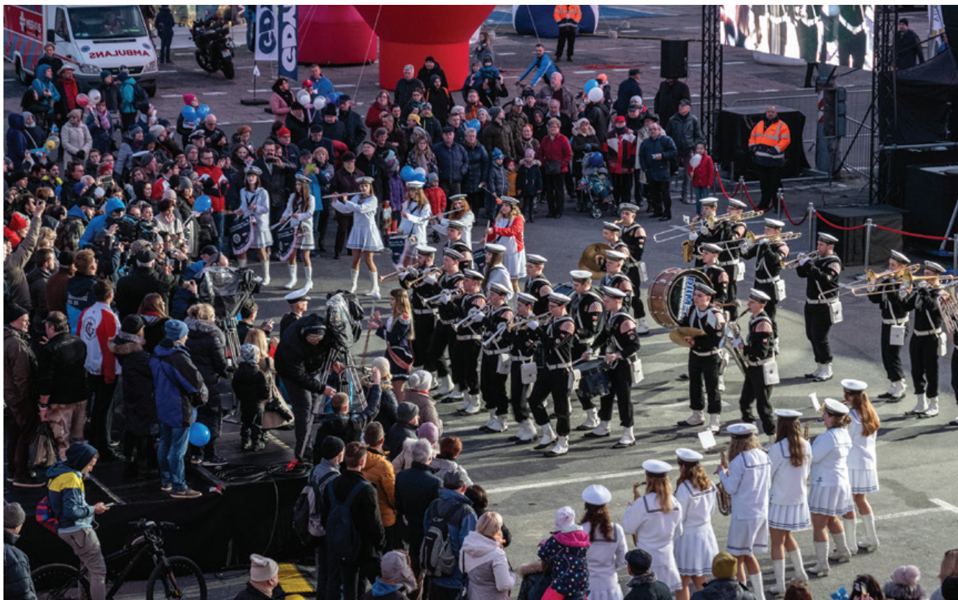
Wśród atrakcji Pikniku Morskiego znalazł się m.in. występ Orkiestry Reprezentacyjnej Marynarki Wojennej oraz pokaz musztry paradnej.

Powrót najpiękniejszego polskiego żaglowca nie oznacza możliwości podziwiania go na gdyńskim wybrzeżu, lecz zwiastuje nadejście kolejnych pracowitych dni. Nie minęły dwie doby od zakończenia wokółziemskiej podróży, a „Dar Młodości” wyruszył już w kolejny rejs z młodymi żeglarzami – tym razem w rejony duńskich cieśnin.